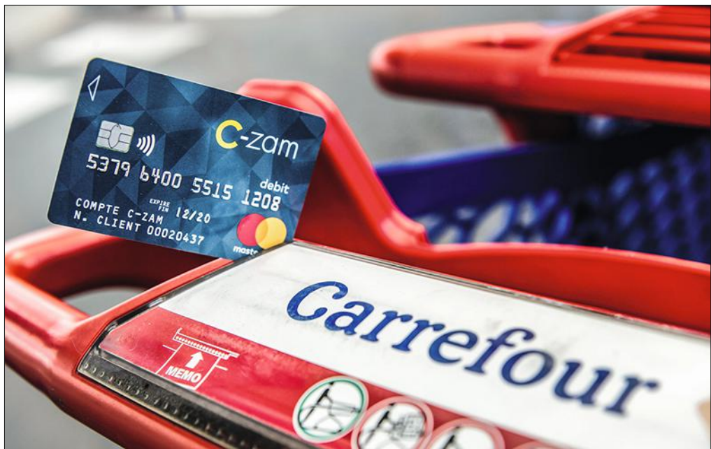
Avec C-zam, Carrefour espère séduire les millions de clients qui remplissent leur Caddie chez lui.

Le numéro un européen de la grande distribution vient marcher sur les plates-bandes des banques en ligne comme ING Direct ou Boursorama. Il espère surtout rencontrer le même succès que Compte-Nickel. Ce service de cartes de paiement prépayées, à souscrire chez les buralistes, a conquis 500 000 personnes en trois ans, sans publicité ni systèmes de parrainage. Carrefour, lui, a un argument de poids à faire valoir. Chaque jour, trois millions de Français déambulent dans ses rayons. Soit autant