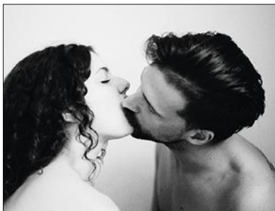
PASCAL SITTLER/REA - FESTO - SP